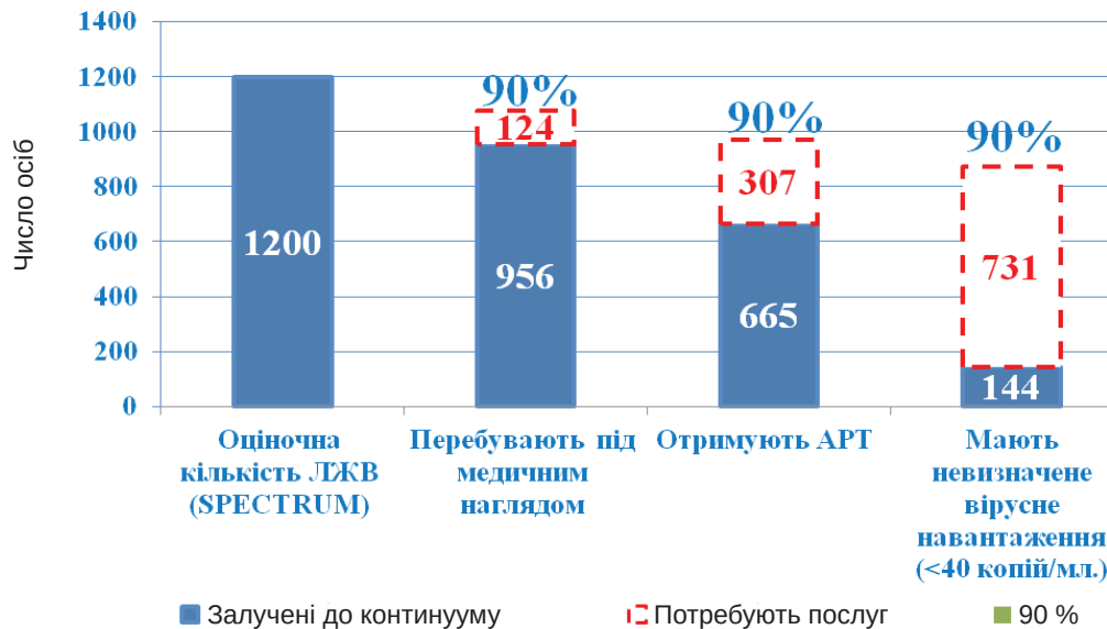
Мал. 2. Каскад послуг для ЛЖВ станом на 01.01.2017 р.

79,6 % від оціночної кількості ЛЖВ знають про свій ВІЛ-позитивний статус й перебувають під МН служби СНІДу в Тернопільській області. Для досягнення цілей стратегії щодо прискорення заходів у відповідь на ВІЛ/СНІД залишаються невиявленими та не взяті під МН ще 124 ЛЖВ. Активна диспансерна група складає 91,5 % (875 осіб) від кількості пацієнтів, які знаходяться під МН.