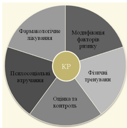
Рис. 1. Основні складові первинної кардіореабілітації [11, 19].

– модифікація факторів ризику ССЗ шляхом навчання пацієнта та поведінкових втручань (консультування з питань здорового харчування, фізичної активності та тренувань, відмови від куріння, контролю нормальної маси тіла, артеріального тиску та рівня ліпідів крові, цукрового діабету) (рис. 1) [16–19].