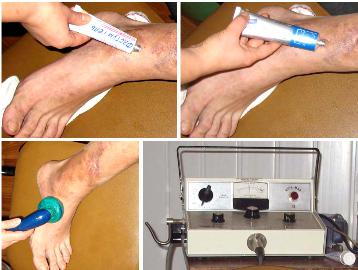
Рис. 1. Нанесення гелів та проведення фонофорезу.

Впродовж 10 діб у комплексній реабілітації проводили фонофорез Фастум гелю® і Ліотону®. Запальний процес був у стадії ремісії (рис. 1).