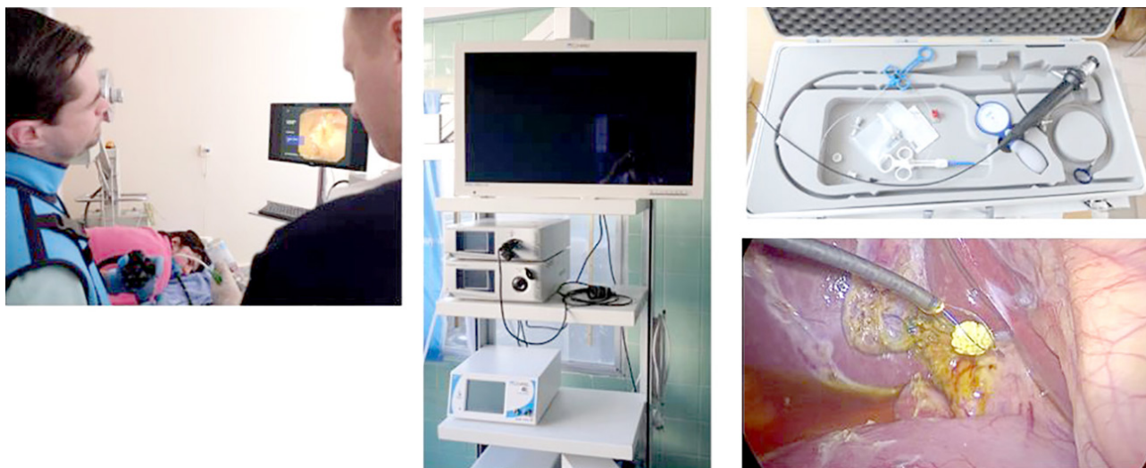
Рис. 2. Виконання літоекстракції методом лапароскопічної холедохоскопії.