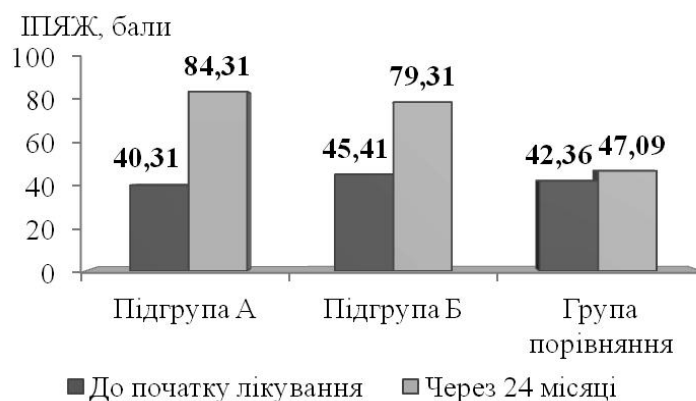
Рис. 2. Характеристика ІПЯЖ у хворих груп дослідження на початку лікування та через 24 місяці після герніопластики.

Співвідношення показників ІПЯЖ у хворих груп дослідження до початку лікування та через 24 місяці після герніопластики відображено на діаграмі (рис. 2).