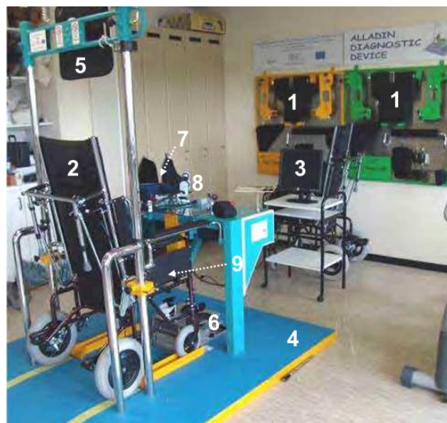
Рис. 3. Компоненти діагностичного пристрою ALLADIN.

Для прикладу представлено діагностичний прилад ALLADIN (рис. 3), який включає дев'ять компонентів, і який використовують у нейрореабілітації для оцінки постінсультного функціонального відновлення. Пристрій включає базу даних, в якій зберігаються усі функціональні показники та інші клінічні показники пацієнта [7, 8, 33, 34].