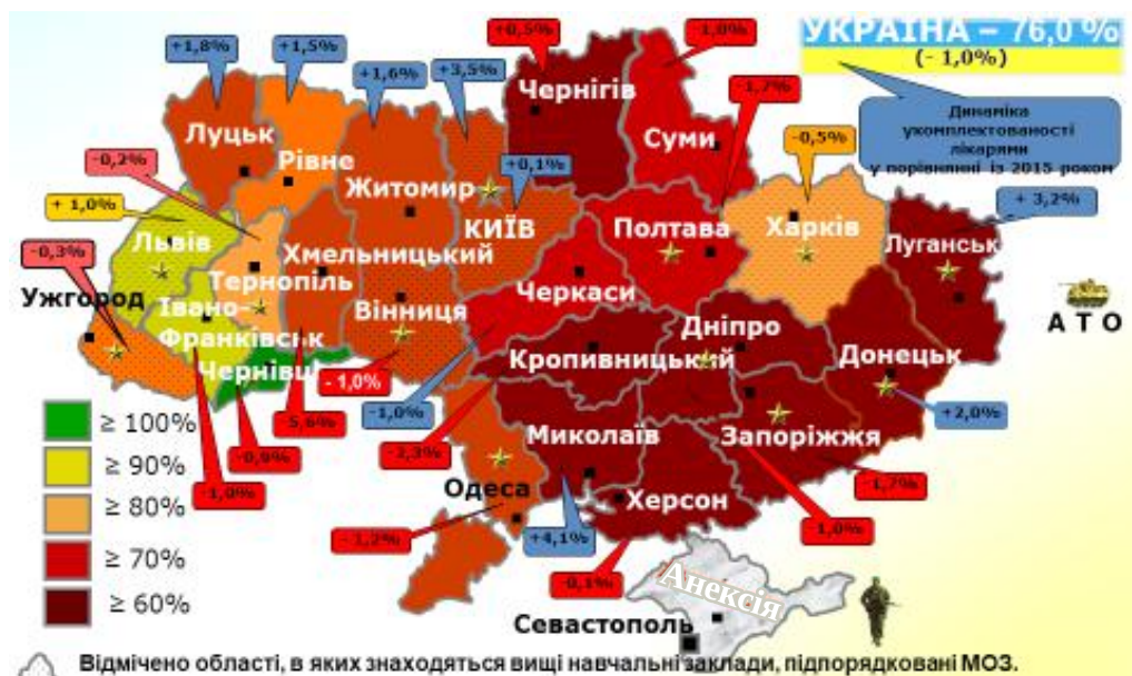
Рис. 1. Укомплектованість посад лікарями зі спеціальності «Педіатрія» за даними автоматизованої бази станом на 01.01.2018 р.

У цілому ж за останні п'ять років внаслідок низки об'єктивних факторів (окупація Криму і війна на Донбасі, втрата Кримського медичного університе-