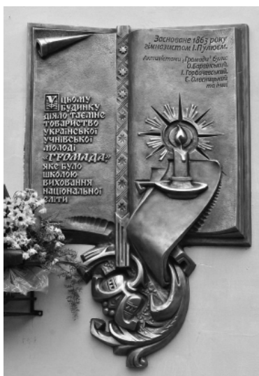
Меморіальна дошка учасникам молодіжного об’єднання “Громада”

У Тернополі на вулиці Жовтневій, 2, поблизу будинку, де збиралися члени таємного товариства, за сприяння академіка Михайла Андрейчина і доцента Тернопільського національного економічного університету Оксани Збожної, у 2014 р. відкрито меморіальну дошку учасникам молодіжного об’єднання