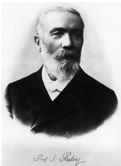
Іван Пулюй (2.02.1845–31.01.1918)

Key words: Ivan Puliui; X-radiation; history of science; medical physics; honoring the memory.