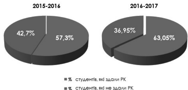
Рис. 2. Порівняння результатів складання тестового проміжного контролю (зимові сесія) з курсу “Загальна патоморфологія” серед англійськомовних студентів 2015–2016 (класична схема навчання) і 2016–2017 (апробація case-based learning) років навчання.

Окрім того, був порівняний відсоток успішно складання тестового проміжного контролю на зимовій сесії з курсу “Загальна патоморфологія” серед англійськомовних студентів 2015–2016 і 2016–2017 навчальних років (рис. 2). Був відмічений приріст частки успішно складених тестових завдань на 5,65 %. Звичайно, що самі по собі, без аналізу впливу додаткових факторів, ці дані не можуть безпосередньо свідчити про ефективність даного методу навчання. Однак певна позитивна тенденція спонукає до його подальшого застосування і майбутній моніторинг успішності студентів, напевне,