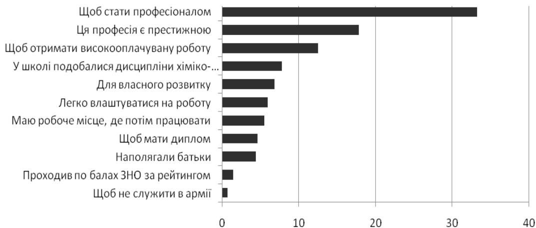
Рис. 1. Розподіл (%) результатів опитування студентів щодо причин обрання професії провізора.

Загальноосвітній навчальний заклад повинен готувати старших школярів до вибору професійної діяльності, при цьому важливим є психологічний аналіз професії та оцінка психофізіологічних властивостей і якостей учнів з урахуванням проб їх сил в обраній діяльності [8]. Цю діагностику повинні проводити в школі психологи. Серед опитаних про світ професій вказали на профорієнтацію на уроках 31 % опитаних. Самостійно цікавились інформацією про професію у довідниках навчальних закладів та періодичній пресі 41 % опитаних. Отже, результати тестування свідчать про низьку інформованість школярів про світ професій та недостатню профорієнтаційну роботу в школах. Тому молодим людям доводилося шукати інформацію самостійно і стихійно.