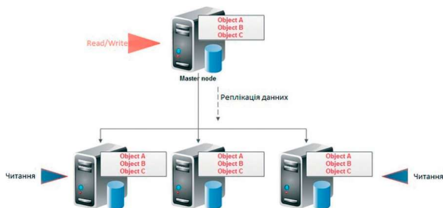
Рис. 2. Peer-to-peer реплікація

акцент на великий обсяг даних, а інші — на велику кількість зв'язків, в яких зберігається не тільки текстова інформація, а й зображення, тому важливо доробляти систему та оптимізувати її вже під конкретне завдання, оскільки створити систему та зробити її максимально простою та універсальною дуже складно. Розглядаючи готові рішення, слід зважувати на ціну, адже, навіть готові програмні продукти потрібно налаштовувати на виконання певних завдань, а в подальшому виділяти кошти та час на підтримку їх функціонування.