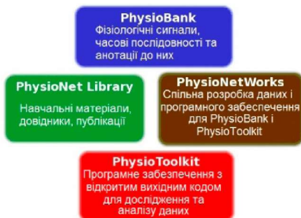
Рис. 1. Чотири головні компоненти PhysioNet.

Отже, PhysioNet — це не лише ім'я ресурсу, але і його портал, http://www.physionet.org/ .