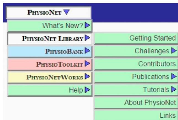
Рис. 2. Навігація по сайту PhysioNet.

Функціонує панель пошуку інформації по сайту. Проте, якщо необхідно знайти сигнали за певними ознаками, такими як тривалість запису, часова або амплітудна роздільна здатність, анотації конкретного типу, вікові або статеві критерії пацієнтів, можна скористатися інструментом для пошуку PhysioBank Record Search (рис. 3) [6]. Однак таким способом можна знайти лише ті записи, котрі є у переліку PhysioBank Archive Index. Згаданий список містить всі наявні на даний час бази даних PhysioBank, організовані відповідно до типів сигналів і анотацій, і короткі описи з посиланнями на більш детальну інформацію про кожну з них.