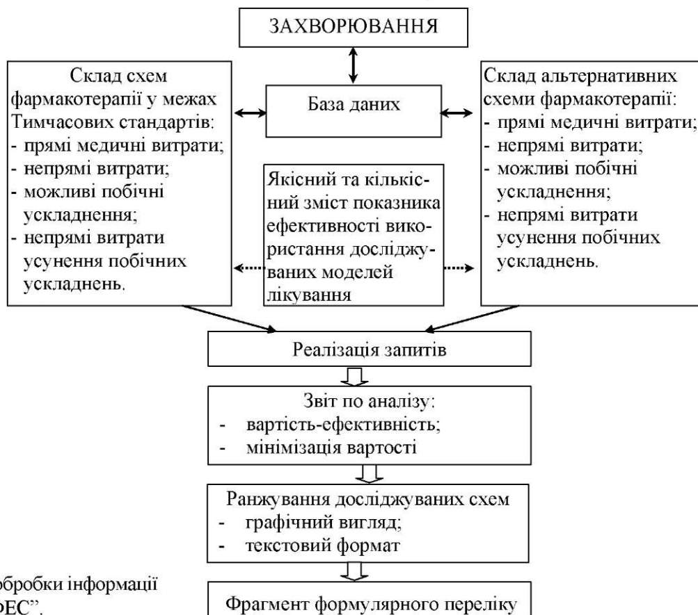
Рис. 3. Схема руху і обробки інформації ІАС "ФЕС".