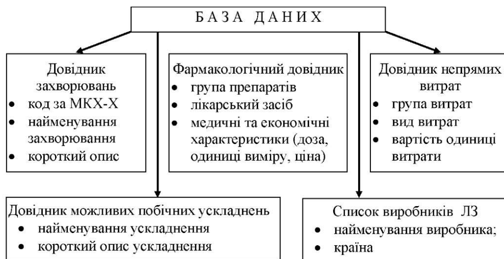
Рис. 2. Структура бази даних ІАС "ФЕС".

Процес руху інформації у ІАС "ФЕС" відповідає основним етапам методики проведення ФЕД (рис. 3).