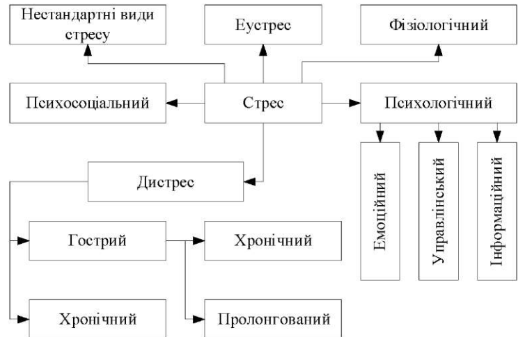
Рис. 1. Класифікація стресу.

Постановка проблеми. Характер стресової реакції, що призводить до адаптації та хвороби, визначається різноманітними факторами: за модальністю - є позитивним і негативним, конструктивним та деструктивним [1].