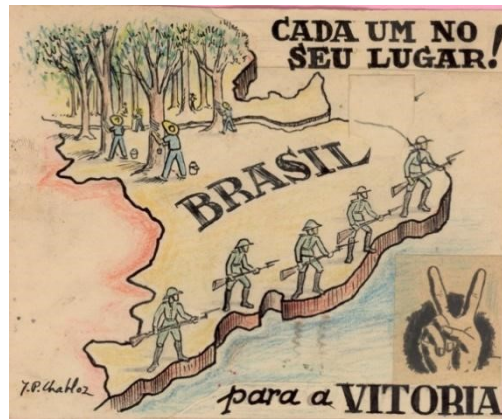
Figura 3: Cartaz elaborado por Jean Pierre Chabloz associado a Batalha da Borracha

Poster made by Jean Pierre Chabloz associated with the Battle of Rubber