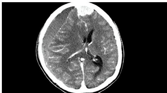
Imágenes 3: Lesión ocupativa de espacio (LOES) frontal. Higroma subdural frontal derecho con efecto de masa compresión del lóbulo frontal desviación de la línea media y compresión ventricular.