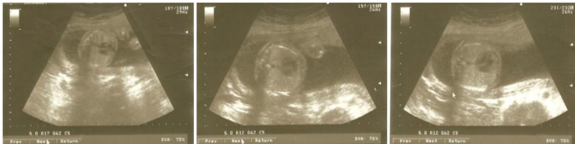
Figura 3. Imágenes del USG: ecogenicidad pulmonar y microquistes en ambos hemitórax (Caso 3).

microquística, y por anatomía patológica se confirma diagnóstico, observándose quiste muy pequeño regular revestido de epitelio alveolar temprano. En la Figura 3 se observa aumento de la ecogenicidad pulmonar y pequeñas imágenes microquísticas en ambos hemitórax.