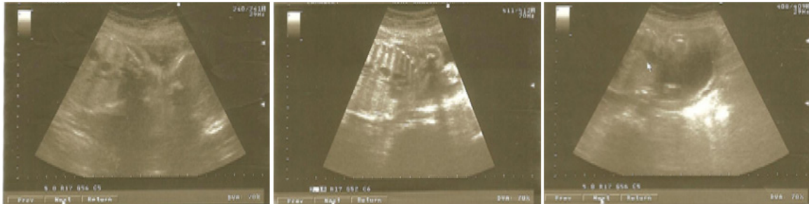
Figura 2. Imágenes ecográficas de malformación adenomatoide quística pulmonar (Caso 2).

quística y por anatomía patológica al feto mediante la técnica ultrasonografía (USG), y se confirma diagnóstico con observación de quiste pequeño revestido de epitelio bronquial. En la Figura 2 se observan imágenes ecolúcidas única en hemitórax derecho, bordes bien definidos y refuerzo posterior, de aspecto quístico.