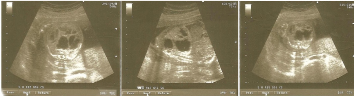
Figura 4. Imágenes del USG: ecolúcidas de bordes regulares y refuerzo posterior en ambos campos pulmonares (Caso 4).

confirmándose diagnóstico por anatomía patológica, y visualizándose quistes muy pequeños irregulares y revestidos de epitelio alveolar. En la Figura 4 se observan múltiples imágenes ecolúcidas de bordes regulares y refuerzo posterior en ambos campos pulmonares.