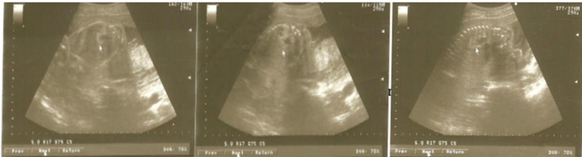
Figura 1. Imágenes ecográficas de malformación adenomatoide quística pulmonar (Caso 1).

En la Figura 1 se observan múltiples imágenes ecolúcidas agrupadas en ambos hemitorax, acompañadas de refuerzo acústico posterior, de aspecto quístico.