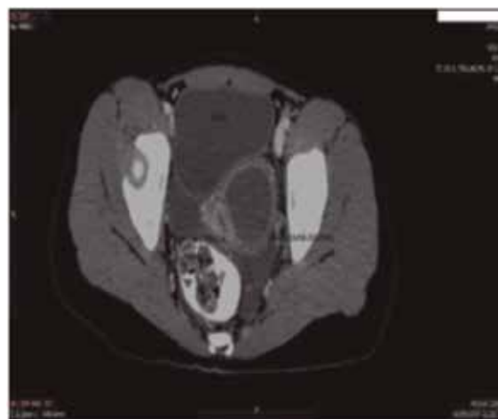
Figura 6. Se observan dos vaginas, la izquierda de caracteres normales desplazada y la derecha ocupada por colección hemática (hematocolpos) SOLCA. Portoviejo