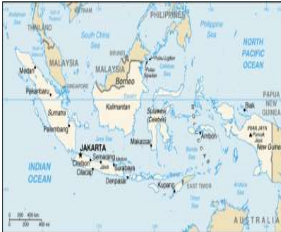
Gambar 1. Peta wilayah negara indonesia

Letak astronomi yang demikian itu menunjukkan bahwa Indonesia terletak di daerah iklim tropika. Hal ini mengakibatkan suhu di Indonesia cukup tinggi (antara 26^{\circ} C - 28^{\circ} C), curah hujan cukup banyak (antara 700mm – 7000mm per tahun), terdapat hujan zenital (hujan naik khatulistiwa), proses pelapukan batu-batuan cukup cepat serta terdapat berbagai jenis spesies hewan dan tumbuhan.