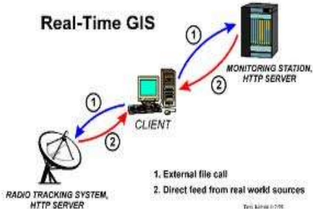
Gambar 3. Konfigurasi aplikasi GIS secara Real-Time (google.com)

Menurut Prahasta (2002), GIS ( Geographic Information System ) atau Sistem Informasi Berbasis Pemetaan dan Geografi adalah sebuah alat bantu manajemen berupa informasi berbantuan komputer yang berkait erat dengan sistem pemetaan dan analisis terhadap segala sesuatu serta peristiwa-peristiwa yang terjadi di muka bumi. Teknologi GIS mengintegrasikan operasi pengolahan data berbasis database yang biasa digunakan saat ini, seperti pengambilan data berdasarkan kebutuhan, serta analisis statistik dengan menggunakan visualisasi yang khas serta berbagai keuntungan yang mampu ditawarkan melalui analisis geografis melalui gambar-gambar petanya dan dapat diakses oleh warga masyarakat secara langsung (real-time).