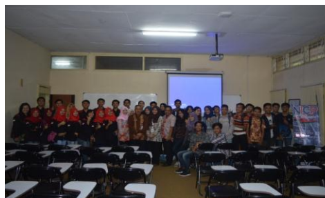
Gambar 3. Peserta Batch pertama Program NICP

Adapun materi yang diberikan pada program NICP ini adalah sebagai berikut.