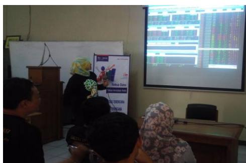
Gambar 5. Materi Pengenalan Simulasi Perdagangan Saham di Bursa Efek Indonesia

Hasil nyata dalam kegiatan praktek perdagangan saham di Bursa Efek Indonesia melalui program NICP ini, bahwa peserta mendapat