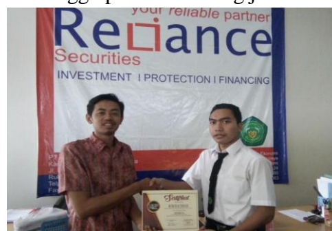
Gambar 6. Penyerahan Sertifikat Program NICP

Pada dasarnya selama program New Investor Class, peserta sangat antusias dan pro aktif dengan adanya kegiatan tersebut, serta menginginkan kegiatan yang bersifat berkelanjutan. Bahkan beberapa diantaranya sudah dapat merasakan keuntungan berinvestasi di pasar modal. Disamping hasil yang dinilai positif, sebetulnya pelaksanaan kegiatan New Investor Class Program tersebut masih banyak kekurangan serta hambatannya, sebagai contoh dalam penerapan aplikasi online melalui Relitrade terkendala dengan jaringan koneksi internet yang kurang stabil, dana untuk investasi yang terbatas, serta alat pendukung lainnya dalam proses pelaksanaan perdagangan saham melalui dealer seperti harus tersedianya perangkat rekaman order, blotter pembelian/penjualan serta menunggu proses rekening jadi.