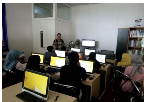
Gambar 4. Pengenalan Materi Pasar Modal pada peserta NICP