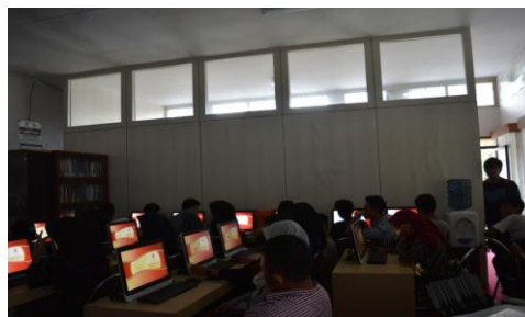
Gambar 1. Kuliah Umum Pasar modal di GIBEI-FE UNSIL-RELI

Literasi yang dilakukan adalah melalui kegiatan kuliah umum dimana dalam kuliah umum ini mampu menangkap peluang investor dan calon investor serta pengenalan pasar modal kepada kalangan masyarakat.