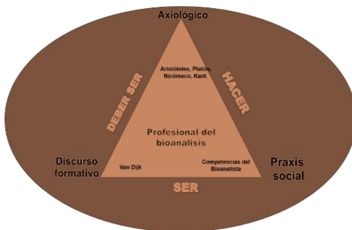
Figura 2. Representación mental: Categorías teóricas de la investigación.