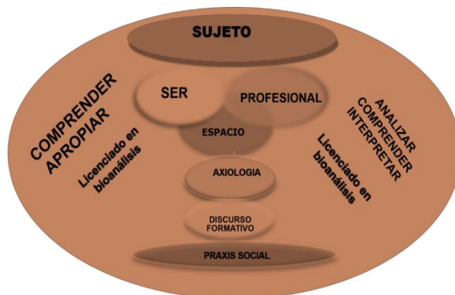
Figura 4. Representación mental: Constructo metodológico.

En el campo metodológico concreto de esta investigación nos encontramos en la necesidad de identificar una los discursos formativos desde lo axiológico que nos permitirá acercarnos a la significatividad del proceso, intentando ubicar las diferentes perspectivas de los actores comprometidos. Y así fue como nos adentramos en las fuentes: valoraciones de los profesionales del bioanálisis y su praxis social; para luego, con este cúmulo de información abordar la interpretación; aquí se tratará de captar el sentido de la experiencia; desde las categorías significativas fuimos ubicando los relatos, los núcleos básicos, hasta descubrir el proceso vivido.