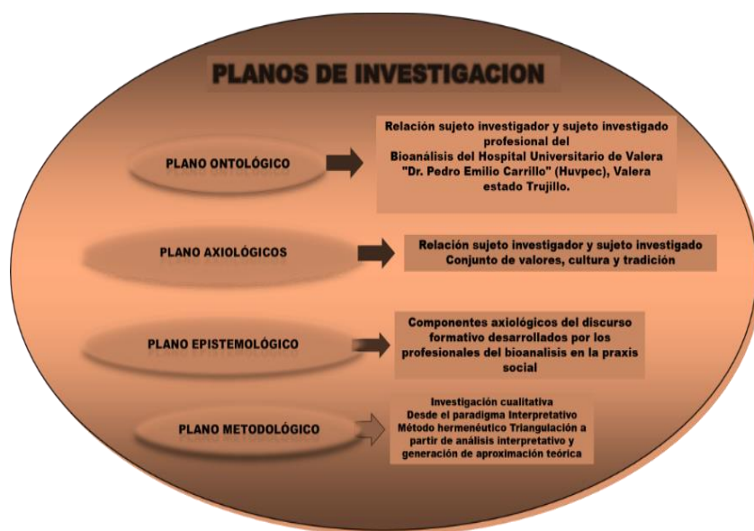
Figura 3. Representación mental: Planos de investigación.

La investigación está enmarcada en el paradigma cualitativo dentro del enfoque interpretativo recursivo, teniendo como método la hermenéutica, Ricoeur citado por Sandoval (1996: 67), expresa que la hermenéutica se define como “la teoría de las reglas que gobiernan una exégesis, es decir, una interpretación de un texto particular o colección de signos susceptible de ser considerada como un texto”.