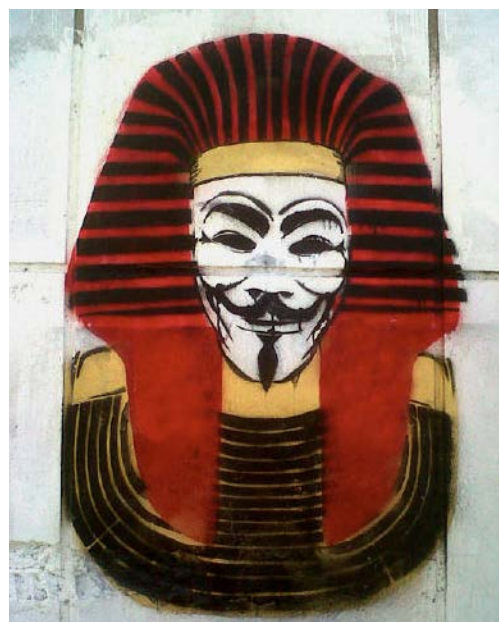
Bilde 1: Vendetta med den faraoniske hodeplagg nemes .

den lokale konteksten. Blant dem finner vi for eksempel Guy Fawkes' vendettamaske iført det gamleegyptiske faraoniske hodeplagg nemes (bilde 1) 4 og bokstavene ACAB («all cops are bastards»). Blant de mer utførlige arbeider var figuren til Joker fra Batman iført en militærlue. Han holder strengene til marionettene og hver dukke representerer en sentral politiker (bilde 2). 5 Kunstneren Amr Nazeers plakat Joke med bildet av president Abdel Fattah el Sisi i samme stil som Shepard Faireys Obama Hope er et annet eksempel (bilde 3). 6 Under den arabiske våren ble de ulike (master)pieces skrevet med ulike skrifttyper og språk, både på arabisk, arabizi dvs. arabisk for internett, engelsk og i noen tilfeller