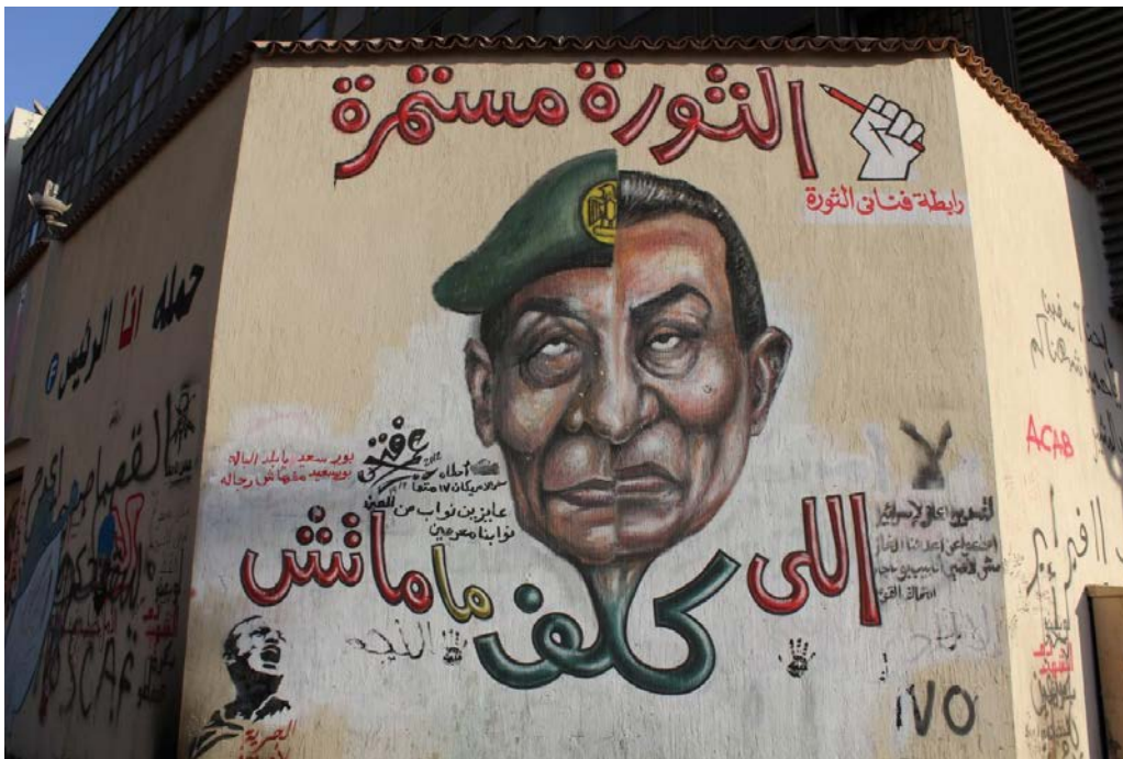
Bilde 9: Den som delegerer dør ikke. Første versjon, av Omar Fathy aka Picasso.

Å! regime du er redd for penselen og pennen, du undertrykker og tramper over dem som har blitt underkuet.