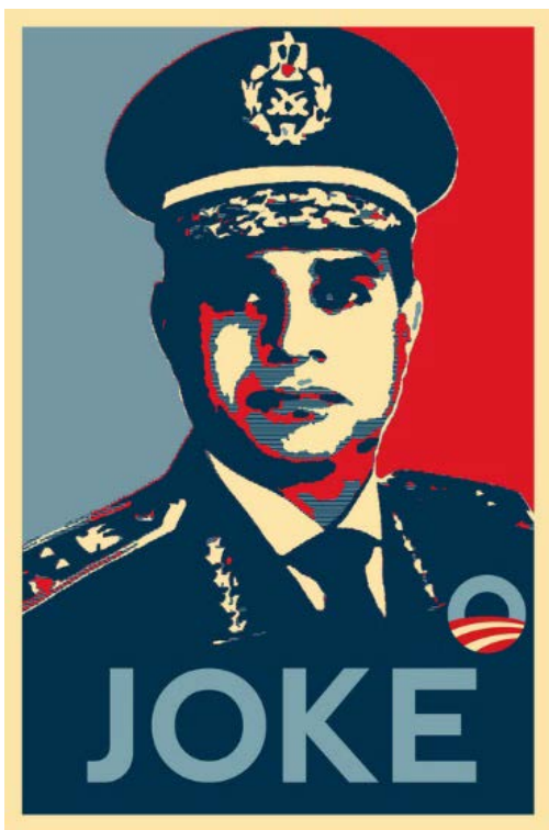
Bilde 3: Joke av Amr Nazeer.