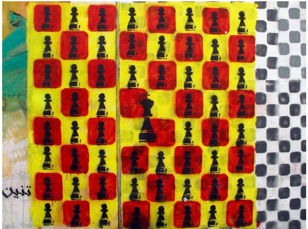
Bilde 13: Kongen er tilbake, av el-Teneen.