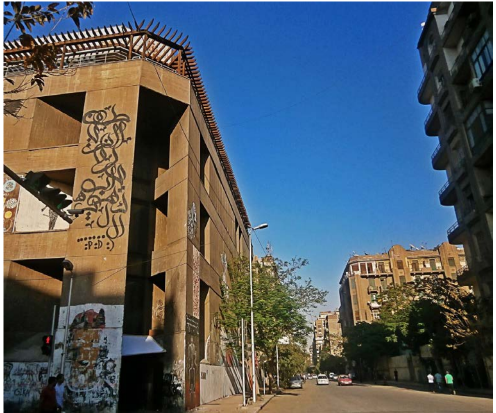
Bilde 14: Kalligraffiti Slå av lyset Bahía, av Ahmed Naguib.