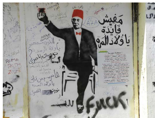
Bilde 11: Saad Zaghloul: Det nytter ikke, drittsekker!