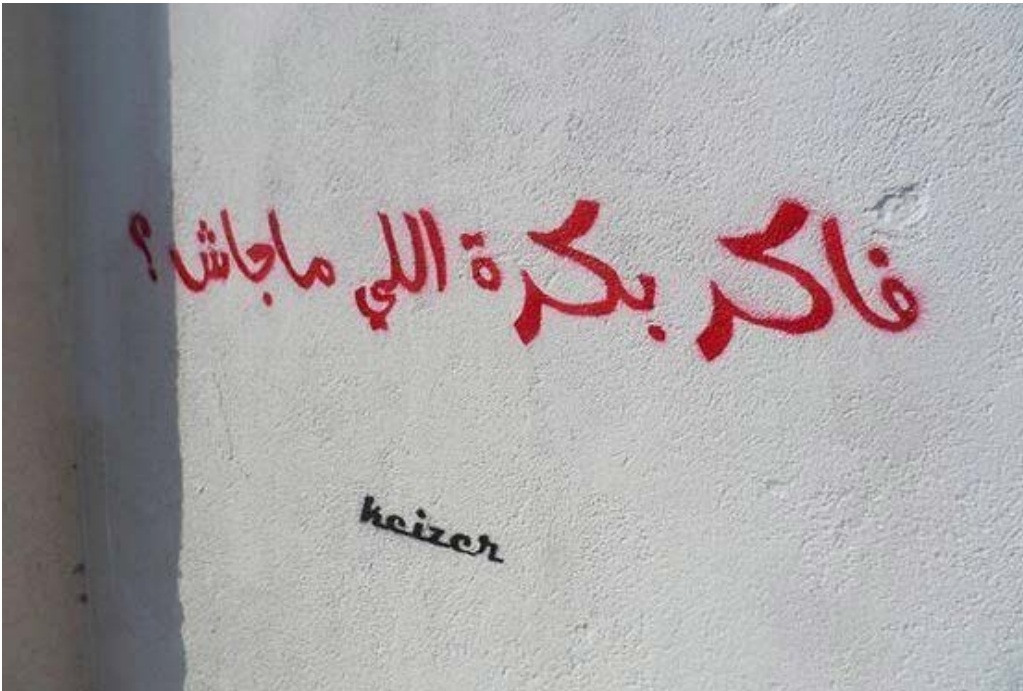
Bilde 12: Husker du i morgen som aldri kom? av Keizer.

fortvilelse om datidens politiske situasjon i Egypt. 20