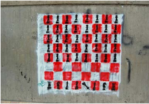
Bilde 5: Ned med kongen! av el-Teneen.

oppsummerer folkekravene på en svært direkte måte.