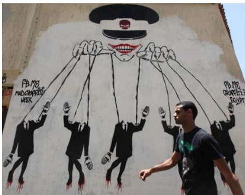
Bilde 2: Joker holder strengene til marionettene.

gammelegyptiske hieroglyfer. Flere graffiti-kunstnere fant inspirasjon av arabisk kalligrafi og utviklet det i nye retninger i det offentlige rom.