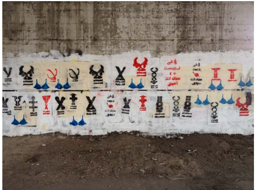
Bilde 6: Kalligrafitti: Nei! og tusen nei! av Bahia Shehab. Foto: Bahia Shehab.

men man kan ikke utsette våren.» oversatt til arabisk (bilde 7). 11 Det andre motivet refererer til jenta med den blå bh , eller den unge kvinne med hijab som ble avkledd og banket opp av politiet 18. desember 2011 (bilde 8). 12 Shebabs kalligrafitti uttrykker «nei til militærstyret», «nei til en ny farao», «nei til unntakstilstands lov», «nei til stripping av folk», «nei til å blinde helter», «nei til brenning av bøker», «nei til vold», «nei til å stjele revolusjonen», «nei til barrierer og vegger» (Shehab 2014; 2016:167–170).