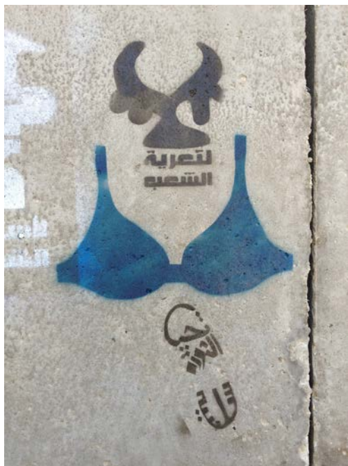
Bilde 8: Kalligraffiti Nei til stripping av folk. Kalligraffiti formet som en militær skoleses: Lenge leve en fredelig revolusjon; av Bahia Shehab. Foto: Bahia Shehab.