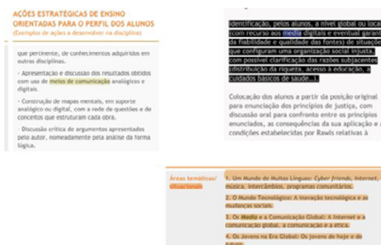
Figura 1: Referências aos media nas Aprendizagens Essenciais das disciplinas analisadas

Focando a questão dos media , e considerando a atualidade das AE, estes são referidos como ferramentas para apoiar a apresentação de trabalhos, realizar tarefas de investigação e pesquisa e temas para abordar a contemporaneidade.