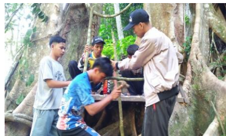
Gambar: Pengembangan Sarana Penunjang