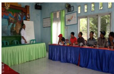
Gambar : Pembuatan sketsa pengembangan ekowisata dan koordinasi dengan perangkat desa serta dinas pariwisata