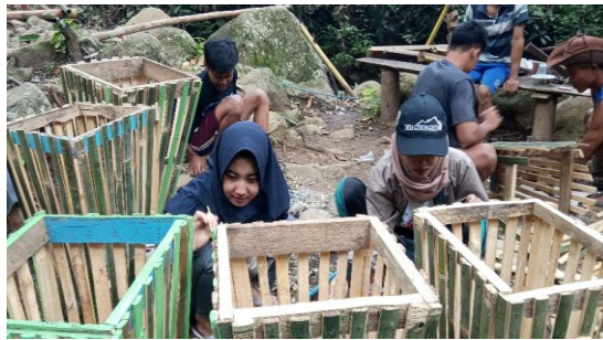
Gambar; Pembuatan tempat sampah

Kegiatan ini dimaksudkan untuk menjaga dan memelihara seluruh asset ekowisata bersama masyarakat. Seluruh lemen masyarakat harus terlibat dalam upaya pemeliharaan ini, termasuk juga pada pengunjung. Sehingga kegiatan kampanye pemeliharaan, penyediaan sarana kebersihan, dan aturan harus dikembangkan dalam upaya melestarikan ekowisata.