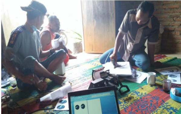
Gambar: Pelatihan Pembuatan Gelas Cantik (Mug)

gunung rejo. Diharapkan dapat membantu perekonomian sekaligus promosi ekowisata di kawasan Gunung Rejo.