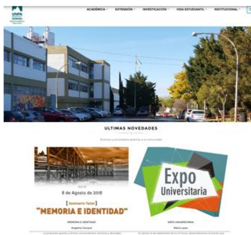
Figura 5 Prototipo sitio UNPA-UACO. Vista móvil de la página principal.