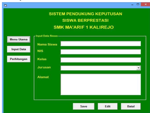
Gambar 3. Form Input Data Peserta Seleksi

Form ini digunakan untuk melakukan proses pemasukan data peserta seleksi berprestasi, seperti Gambar 3 dibawah ini :