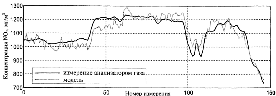
Рис. 2. Изменения \text{NO}_x , полученные с помощью газового анализатора (черная линия) и на основании измерений оптическим зондом (серая линия)

(сплошная линия). Как и на рис. 2, сигналы были синхронизованы с учетом запаздывания от газового анализатора.