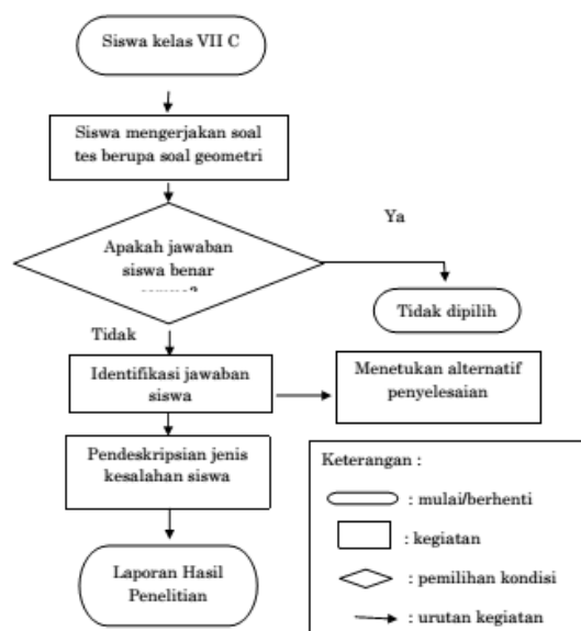
Gambar 1 Diagram Alur Prosedur Pelaksanaan Penelitian

Adapun prosedur pelaksanaan dalam penelitian ini dapat dilihat pada Gambar 1. Dalam Gambar 1 dapat dilihat bahwa penelitian ini dimulai dengan memilih kelas VII C di SMP Negeri 8 Kediri untuk kelas penelitian. Kelas VII C dipilih karena kelas tersebut merupakan kelas yang heterogen dibandingkan kelas yang lainnya. Selanjutnya siswa diminta mengerjakan soal tes berupa soal cerita yang berhubungan dengan geometri (segitiga dan segiempat). Kemudian jawaban semua siswa diidentifikasi letak kesalahan yang dilakukan berdasarkan Newman's Procedure . Setelah melakukan identifikasi jawaban siswa ada dua hal yang dilakukan yakni menentukan alternatif penyelesaian dan pendeskripsian jenis kesalahan siswa dalam menyelesaikan soal geometri (segitiga dan segiempat). Hasil pendeskripsian jenis kesalahan siswa inilah yang nantinya akan ditulis dalam laporan penelitian.