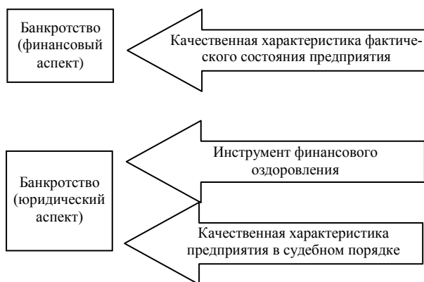
Рис. 2. Формы проявления категории банкротства

правовой реабилитационный механизм, направленный на финансовое оздоровление кризисного субъекта хозяйствования. С этого момента банкротство начинает выступать не только в роли качественной характеристики финансового состояния предприятия, а в большей степени как форма инновации, способной повысить стоимость организации [6]. Формы проявления банкротства представлены на рис. 2.