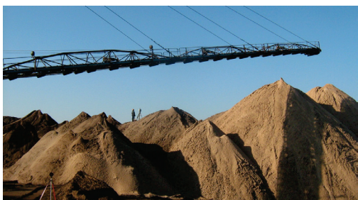
Рис. 1. Солеотвалы. Использование лазерного сканера Leica ScanStation C10 для создания цифровой модели рельефа

В целях охраны окружающей среды и сохранения земельных угодий разработан и используется способ высотного складирования галитовых отходов в солеотвалы (рис. 1). На сегодняшний день они заметны за многие километры и представляют собой красноватые горы, достигающие в высоту 120–150 м.