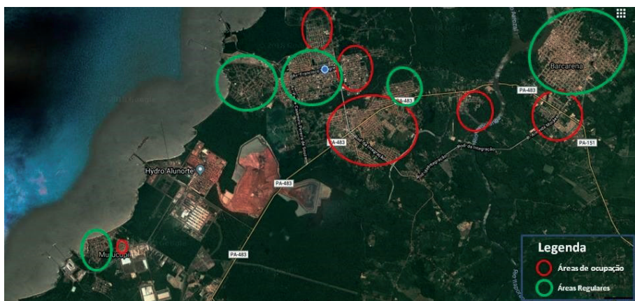
Fotografia 4 – Imagem de satélite Barcarena, 2018

Para Nahum (2006, p. 44), “ao término de cada fase da obra parte dos migrantes fixa residência em Barcarena, agravando o já profundo déficit de infraestrutura e serviços urbanos do município”. Esse aumento populacional transformou a própria organização territorial do município, que acabou refletindo focos de ocupações espontâneas de forma irregular, como pode ser observado na Fotografia 4, que possibilita visualizar as áreas de ocupações regular e irregular, imageadas por satélite.