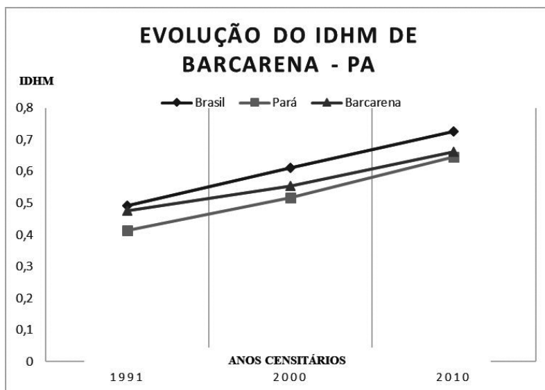
Gráfico 2 – IDHM de Barcarena, no Pará e Brasil, 1991-2010

Fonte: PNUD; IPEA; FJP apud ATLAS BRASIL (2013). Adaptado pelos autores.