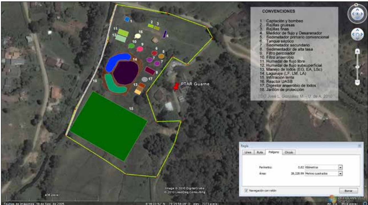
Figura 1. Esquema de flujo propuesto para la planta experimental

En primer lugar, se realizó una evaluación del estado del arte y de las condiciones de aplicación de los diferentes procesos de depuración convencional y no convencional, apoyados en una revisión de la información publicada sobre instalaciones de este tipo y en un conjunto de visitas llevadas a cabo a plantas convencionales en la región como la planta de tratamiento de aguas residuales del municipio de Guarne, la planta San Fernando ubicada en el municipio de Medellín y la planta de tratamiento