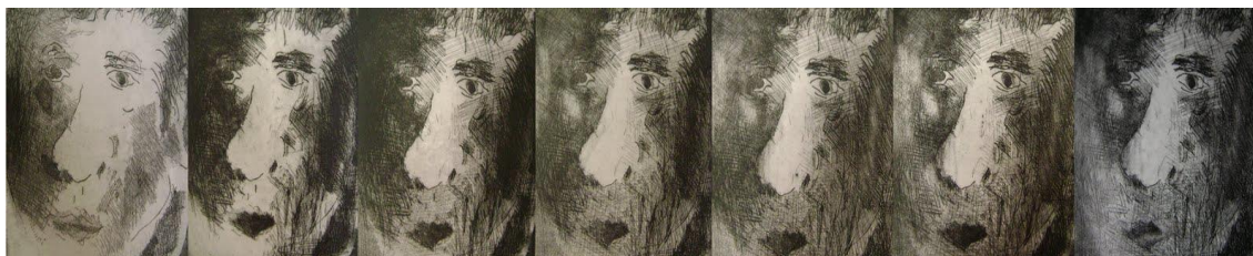
Imagem 6 - Pannel Estados , composto por 19 gravuras em metal. Júlia Salgueiro.

Recebido em: 01 de abril de 2019. Aprovado em: 15 de setembro de 2019. Publicado em: 20 de dezembro de 2019.