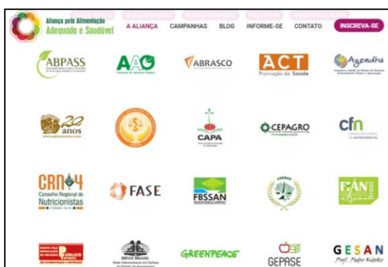
Figura 1: http://alimentacaosaudavel.org.br/a-alianca/quem-somos/ , acesso em 19 de julho de 2018.

Essas informações estão presentes no site da Organização e servem inicialmente para conhecermos os sujeitos interessados na biopolítica do corpo saudável e os objetivos que pretendem alcançar com tal política que gere a vida. Além disso, a proposta é uma política para a governamentalidade do corpo por meio de dispositivos de segurança alimentar e nutricional (biopoderes). Ressaltamos também os membros dessa Organização, disponibilizados também no site oficial, antes de adentrarmos propriamente aos discursos presentes no vídeo.