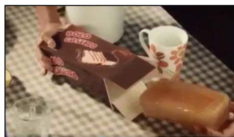
Figura 4: Captura de tela.

A campanha pretende alertar e engajar os consumidores com relação às informações claras nos rótulos e restringir propagandas enganosas, com prioridades às voltadas ao público infantil. A ênfase voltada a esse público é justificada pela biopolítica que pretende atingir essa parte da sociedade para futuramente diminuir o número de casos de obesidade na sociedade.