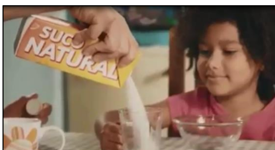
Figura 3: Captura de tela.

O vídeo inicia com uma pergunta you know what to eat? e apresenta uma família reunida à mesa. Há ênfase nos rótulos dos produtos industrializados, na cena do café da manhã, Suco natural , bolo caseiro e cereal integral que não contém açúcar, sódio e gorduras. O poder/saber passa a gerir a vida sob a forma de biopoder (segurança alimentar) que está dentro de uma biopolítica que classifica e normatiza, por meio das políticas de verdade sobre o corpo, informações que regulamentem e prolonguem a vida dos sujeitos.