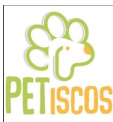
Figura 2. Identidade visual da ação de extensão PETiscos.