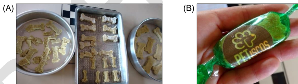
Figura 4. Petiscos preparados pelos estudantes no projeto PETiscos. A, biscoitos não assados; B, biscoito assado e embalado fornecido aos estudantes.

A massa preparada de petiscos foi moldada utilizando cortadores de biscoito em formato de ossinhos e dispostos em assadeiras (Figura 4A). Na sequência, os petiscos foram acondicionados pela equipe do projeto, pois optou-se por não assar os petiscos na escola. Biscoitos assados e embalados previamente foram então fornecidos aos estudantes para observarem o produto final e para presentear seus pets (Figura 4B).