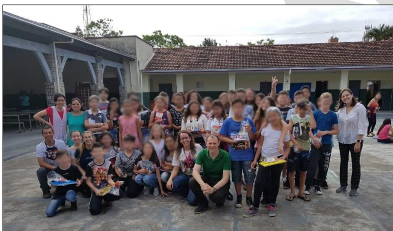
Figura 1. Participantes estudantes, professores e equipe executora da ação de extensão PETiscos. As faces foram desfocadas para preservar a identidade dos estudantes.

A população alvo da ação foi composta por 48 estudantes (faixa etária aproximada de 11 anos) e dois professores do sexto ano vespertino de uma escola de ensino fundamental do município de Araquari - SC. Os pais ou responsáveis legais dos estudantes foram informados e autorizaram por escrito a participação das crianças na ação, bem como a captação e uso de imagens durante a execução. A ação foi realizada inteiramente dentro da escola, sob supervisão da equipe executora e professores dos estudantes participantes (Figura 1).