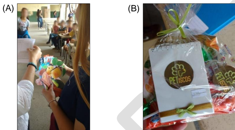
Figura 5. Atividades realizadas na 3ª etapa da ação de extensão. A, jogo interativo e reforço dos temas ensinados; B, sacola de lembrancinhas e caderno de receitas PETiscos. As faces foram desfocadas para preservar a identidade dos estudantes.

A ação foi finalizada com a distribuição de sacolas de lembrancinhas contendo um caderno de receitas de petiscos, entre elas aquela executada pelos estudantes, algumas orientações de manejo nutricional de cães e gatos, informações sobre alimentos permitidos e proibidos para cada espécie, bem como brindes das empresas apoiadoras da ação (Figura 5B).