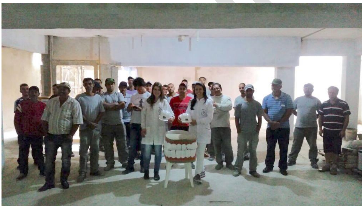
Figura 1. Trabalhadores da construção civil e acadêmicos presentes na ação. Ponta Grossa-PR, 2017.

A ação ocorreu no espaço físico de uma obra em andamento, no mês de março de 2017, no local destinado à convivência dos funcionários (Figura 1).