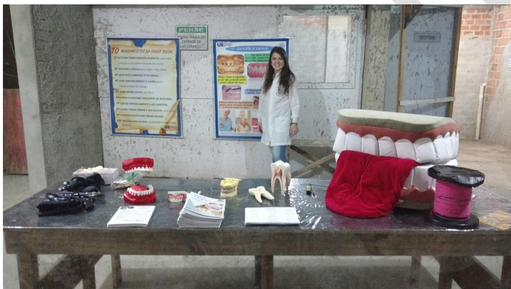
Figura 2. Instrumentos educativos utilizados na ação junto a trabalhadores da construção civil. Ponta Grossa-PR, 2017.

Buscando desenvolver habilidades pessoais e a ampliação das concepções dos trabalhadores sobre a saúde e a doença bucal, foram utilizados diferentes métodos e recursos educativos durante a atividade, tais como banners com ilustrações explicativas, macromodelos de arcadas dentárias e de instrumentos de higienização bucal (Figura 2). Como instrumento de educação em saúde, valeu-se também de roda de conversa sobre as práticas de saúde bucal no ambiente laboral, com momento de ‘tira-dúvidas’. Utilizou-se, ainda, uma cartilha informativa intitulada “ Você sabia? 10 curiosidades sobre saúde bucal ” e um panfleto denominado “ Saúde bucal do trabalhador ” (Figura 3). Todos os recursos educativo-preventivos utilizados foram desenvolvidos pelo projeto extensionista em questão.