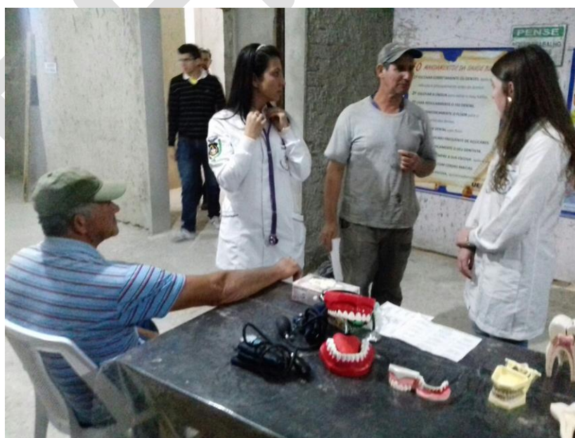
Figura 4. Realização de exame físico em trabalhadores da construção civil. Ponta Grossa-PR, 2017.

Durante a atividade, todos os trabalhadores civis foram submetidos à realização de um exame clínico bucal para avaliação da condição de saúde de tecidos duros (dentição), moles (gengivas, língua, bochecha, lábios e palato), e presença de próteses parciais ou totais removíveis. Ainda, realizou-se aferição da pressão arterial (Figura 4).