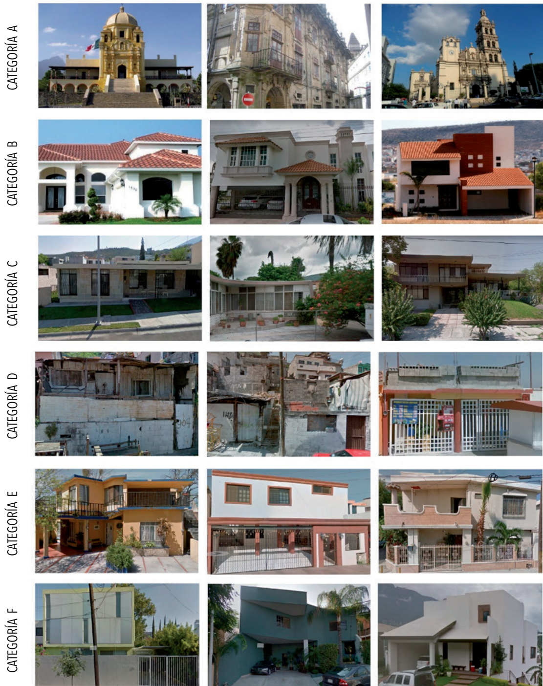
Figura 1. Composición de imágenes de edificaciones localizadas en distintas zonas de la ciudad de Monterrey México, ilustrando las 6 categorías que se lograron distinguir