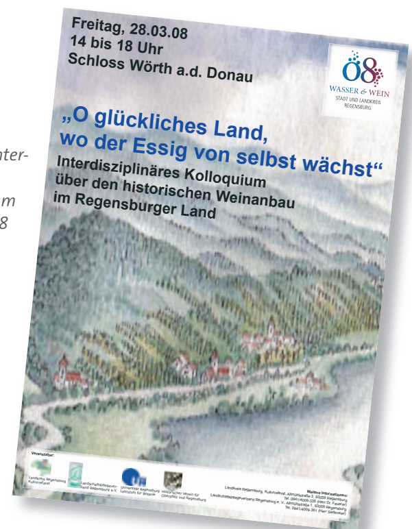
Abb. 1: Plakat zum interdisziplinären Kolloquium am 28. März 2008

Landesgeschichte („Schriftliche und kartographische Quellen zur Geschichte des Weinbaus im altbayerischen Donauraum. Aussagekraft und Auswertungsmöglichkeiten“); Martina Winner M.A., Universität Regensburg, Institut für Germanistik, Forschergruppe NAMEN („Der Wein und die Namen. Zur Manifestation des Weinbaus in der Namenlandschaft