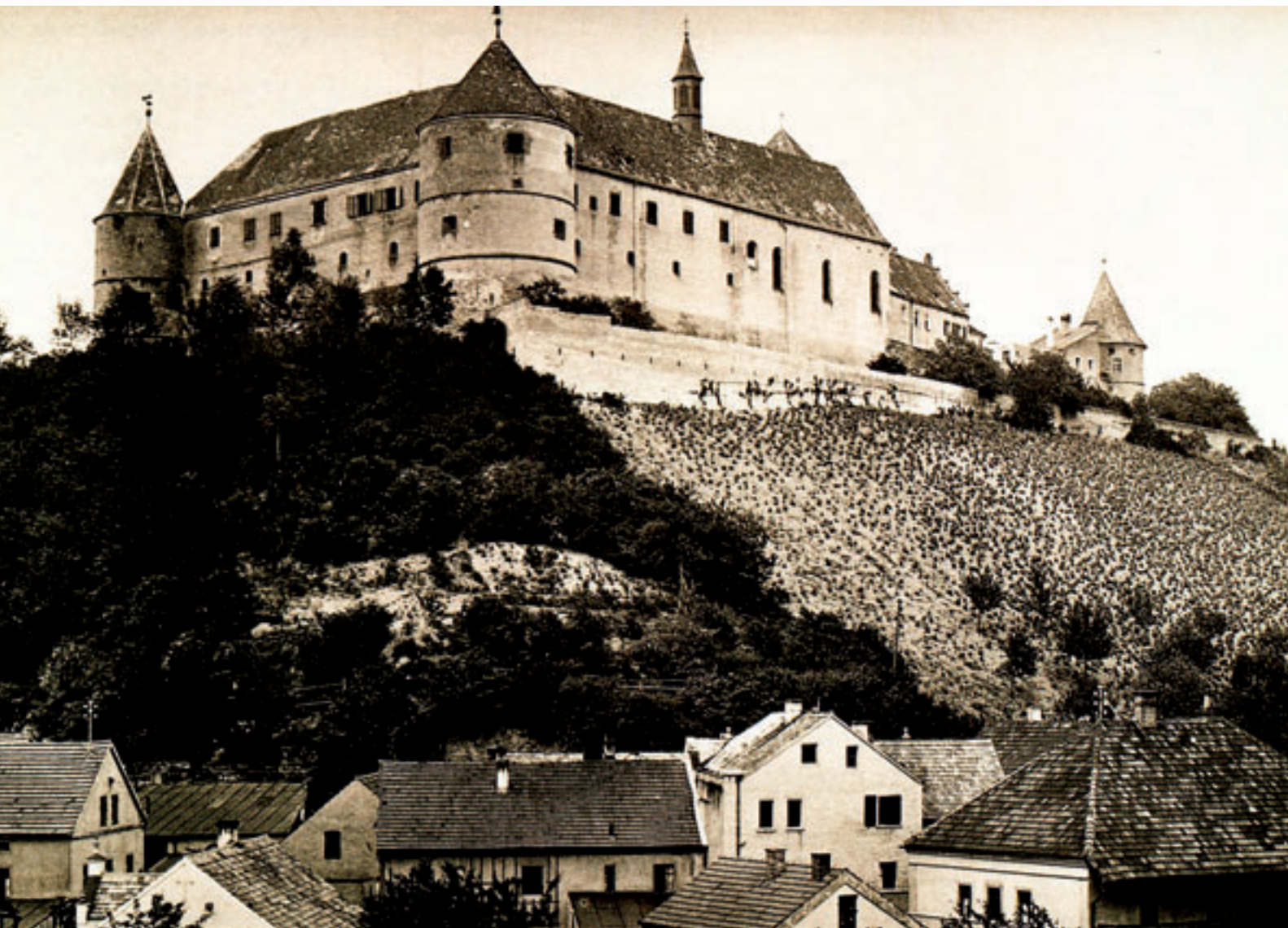
Abb. 2: Schloss Wörth a. d. Donau, der Schlossberg mit Reben bestockt, ca. 1920