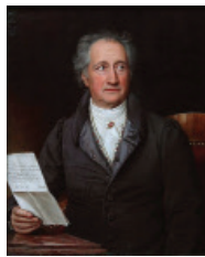
JOHANN VOLFGANG VON GOETHE (1749-1832)