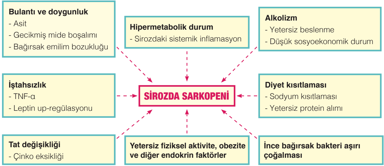
Şekil 2. Sirozda sarkopeni.