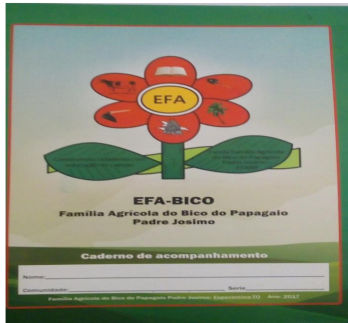
Figura 1- Caderno de Acompanhamento

O Caderno de Acompanhamento é um dos instrumentos Pedagógicoa mais importantes para a formação identitária dos sujeitos do campo, pois nele é feito o acompanhamento integral do educando, é um instrumento que tem como principal função vincular a família do estudante a escola além de proporcionar com que a família que na maioria das vezes mora no campo e em outros municípios, acompanhe o desenvolvimento e a participação dos filhos na sessão escola (TE).