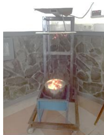
Gambar 3. Implementasi Sistem

Arduino dan dibandingkan dengan alat ukur Combustible Gas Detector A8800L. Hasil pengujian data disajikan pada Tabel 4.