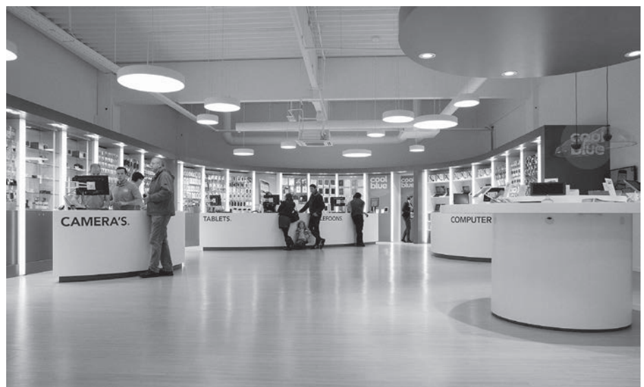
Figuur 3. Interieur van een Coolblue-shop.

Zowel in het model van Verhoef e.a. (2009) als in dat van Levy e.a. (2014) is de link met retaildoelen niet direct zichtbaar en daarmee dus ook niet op welke wijze de retailinstrumenten kunnen worden gebruikt. Om die reden is het wenselijk om beide modellen te combineren met het model van Alsem (2017) en dat van Alsem en Kostelijk (2016), waarin onderscheid wordt gemaakt tussen marketing als strategie (doelgroepkeuze en positionering) en marketing als tactiek (de vier P's plus een vijfde P, die van personeel). Zij stellen dat veel ondernemingen in de dagelijkse praktijk te zelden bewust stilstaan bij de strategische keuze van de positionering en zich te vaak en soms te ad hoc bezighouden met de tactische invulling van de marktinstrumenten. Richtlijnen bij het kiezen van een positionering ('merkwetten') is dat die gefocust ofwel scherp moet zijn, onderscheidend en relevant voor de doelgroep en consistent moet worden uitgedragen.