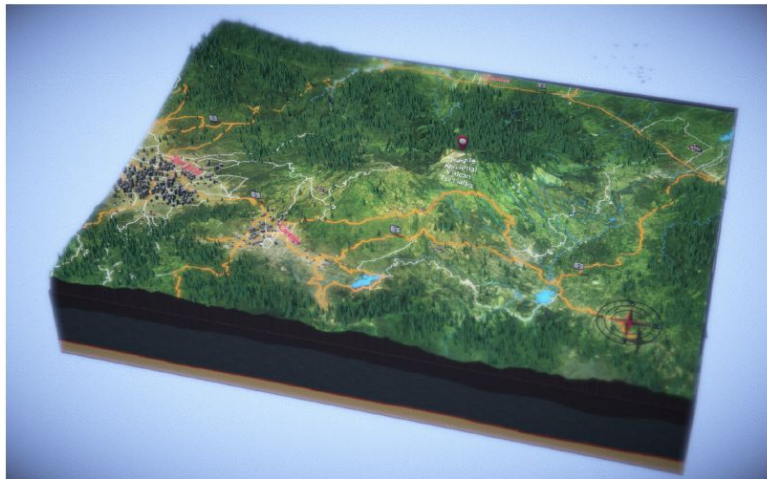
Figura 2. Visualización del área de un sismo alrededor del Volcán Turrialba.