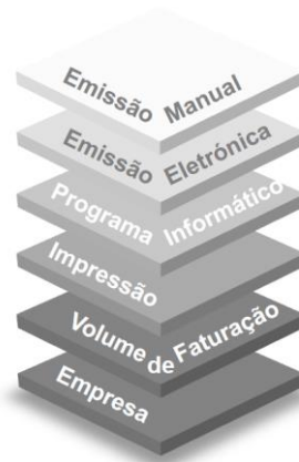
Figura 1. Níveis de decisão.

A utilização de camadas da Figura 1, não implica que os temas sejam desconexos, os temas estão interligados e complementam-se. Por cada camada visitada existe um degrau de incremento no conhecimento sobre as características da faturação na organização. Faltando conhecimento sobre alguma camada, poderemos ter uma visão da solução, mas será uma visão parcial (Russo & Reis, 2019).