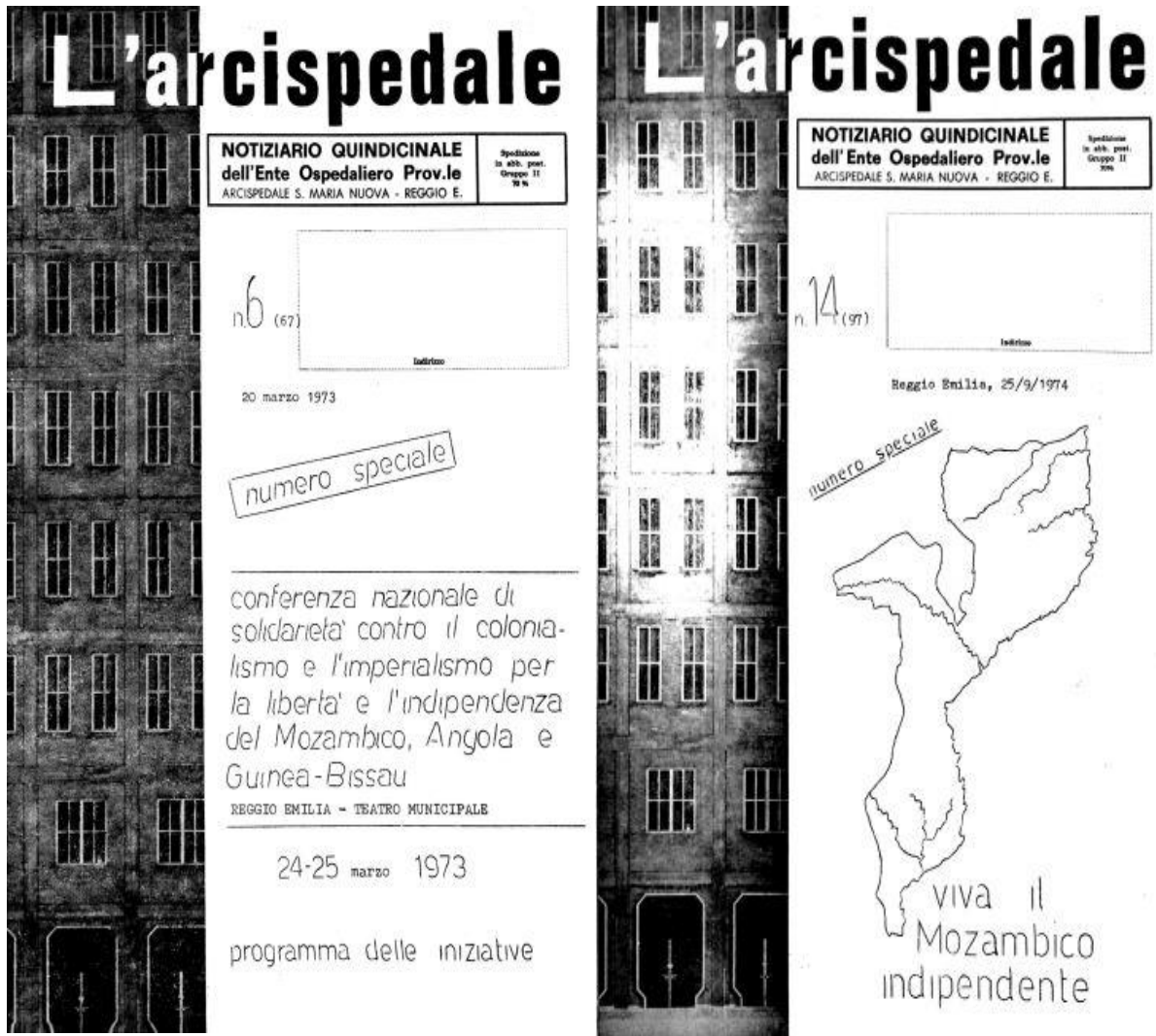
Immagine 9. Copertine notiziario L'Arcispedale n. 6 e n. 14.