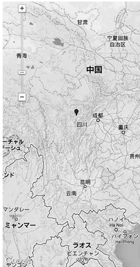
地図 1 中国西南部における梭坡郷の位置 http://ktgis.net/gcode/index.php の Geocoding を用いて作成

語順は動詞（句）が文末にくるのを基本とする。実際の発話によってはそうでない場合も見受けられる。また、名詞句内の修飾構造は修飾語が被修飾語に後置されるのを基本とするが、特定の接辞を用いて前置される場合も認められる（鈴木 2013, 2016）。