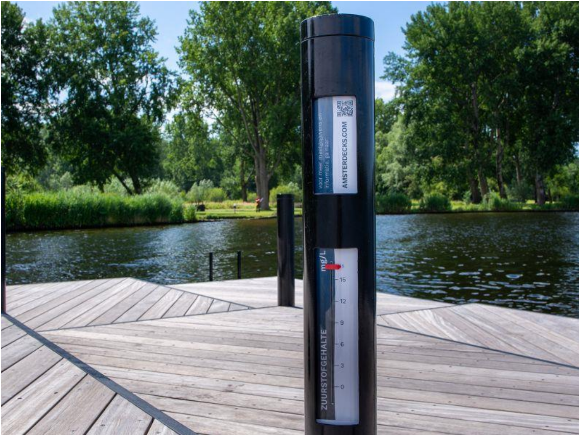
Fig. 3. Smart Citizens Lab. The Amsterdecks Project: Primera plataforma para el baño público.

que las complementan, estimulan y las amplían, por ello, se han convertido en impulsoras de los cambios en del espacio físico de la ciudad, puesto que son plataformas de datos vinculados a acciones sobre espacios concretos de la textura urbana, y por tanto, afectan directamente sobre el funcionamiento de los mismos, , induciendo a su transformación.