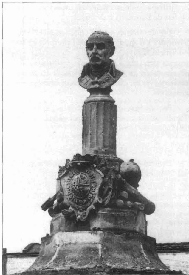
FOTOGRAFIA 1. Bust de Baldomero Espartero a la plaça del Duc de la Victòria (popularment d'Espartero i ara plaça del Gas).

repercussions que la repressió pot tenir sobre Sabadell, vila en què « may sabem entendrem ».