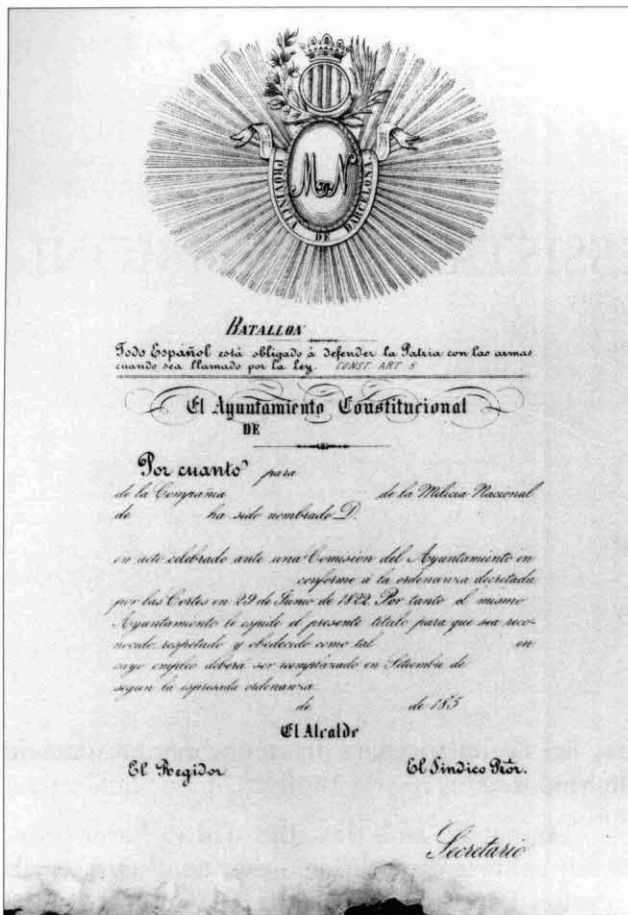
DOCUMENT 1. Impress per al nomenament de càrrecs de les companyies de la Milícia Nacional de la província de Barcelona. AHS, 7.1.1.-7.2.2. Defensa, 1824-1859, doc. 1116.

provenien de les classes subalternes. Aquest biaix social de la base determinà que la milícia assumís sovint les reivindicacions populars 5 i que es fes ressò de les expressions polítiques extremes del liberalisme: progressistes i demòcrates. Per això, a la fi del bienni, la Milícia s'oposà al canvi de govern que significava l'exclusió dels progressistes. 6