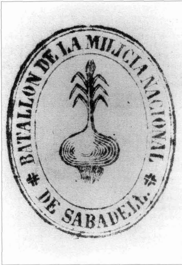
IL·LUSTRACIÓ 1. Segell del batalló de la Milícia Nacional de Sabadell, 1855. AHS, 7.1.1.-7.2.2. Defensa, 1824-1859, doc. 1055.

talló de la Milícia Nacional de Sabadell, amb les seves set companyies, ultrapassava els límits desitjats per la Diputació. 9