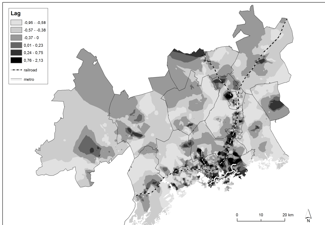
Kuvio 2. Havaittu sosiaalinen epäjärjestys Helsingin seudulla (Lag: interpoloitu alueellinen keskiarvo). Kartta: Perttu Saarsalmi.

Kuvio 3 esittää tarkemmin Helsingin metropolialueen urbaania aluetta. Siitä huomataan, että tulkintaa raideliikenteen asemista täytyy täsmentää. Esimerkiksi Kauniainen on varsin vaaleasävyinen asemasta huolimatta, ja sama koskee Huopalahtea. Tämä havainto vie ajatuksen nopeasti sosio-ekonomisten erojen suuntaan, sillä nämä mainitut asemanseudut ovat varsin hyväosaisia. Näyttääkin siltä, että rauhattomuuden tai häiriöiden havainnot noudattavat ainakin pääpiirteittäin sosio-ekonomisten resurssien jakautumista. Varakkaammat alueet ovat rauhallisia, huono-osaisemmat taas rauhattomampia. Poikkeuksiakin toki on. Otaniemen absoluuttinen tulotaso on kyllä matala ja havaittujen häiriöiden taso on suhteellisen korkea. Kyse on kuitenkin sosiaalisesti