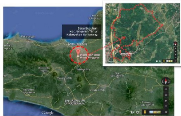
Gambar 1. Peta Hutan Wisata Penggaron Ungaran Jawa Tengah ( https://biroinfrasca.jatengprov.go.id/ )

puspa dan hutan campuran. Metode penelitian yang digunakan adalah metode jelajah (Rugayah et al. , 2004). Pada setiap lokasi dilakukan pencatatan jenis tumbuhan yang bersifat invasif dan dihitung jumlah individu setiap jenisnya. Jenis-jenis yang belum diketahui nama spesiesnya dibawa ke laboratorium untuk dilakukan identifikasi. Dilakukan pengukuran faktor lingkungan yang meliputi: ketinggian tempat, pH tanah, kelembaban udara, suhu udara.